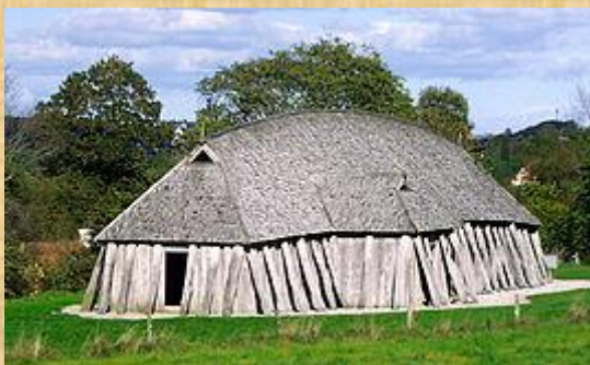
Възстановка на викингска дълга къща

Викингите от тази епоха не живеят в градове . Някои обитават малки села , но повечето живеят в изолирани, отдалечени едно от друго стопанства. Богатите стопанства създават условия за оформянето на отделни общности, в рамките на самите имения. Населението на населените места рядко надвишава 100 души. [1]